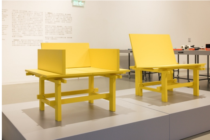
〈最大值 +1,5 度〉, Atelier Ferraro, 可變形家具

「關係設計」既可以被理解為一種社會實踐，也是一種培養人類和非人類行為者之間的社區和相互聯繫的工具。有見及此，展覽設計設有不同區域，以滿足互動（玩）、研究（讀）和娛樂（睇）的需求，相比起每個人自身的享受，這部分的展覽更重視透過鼓勵公眾參與來實現集體體驗，將空間轉變為一個包容且充滿活力的整體，超越了傳統的展覽，旨在透過強調跨界別的聯繫和參與，將展覽打造成一個歡迎任何人到訪的環境。