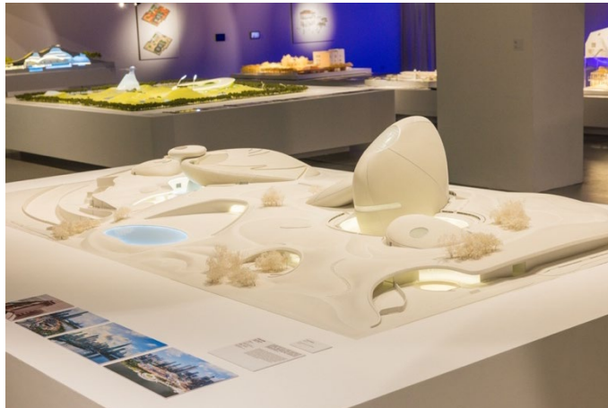
深圳灣文化廣場，中國深圳（2018 – 2025）

展覽焦點還有 MAD 令人嘆為觀止的活化保育項目，包括團隊為荷蘭鹿特丹 FENIX 移民美術館進行的翻新工程。該項目通過打開建築物的中央結構和屋頂，擴展了原有的倉庫，形成一個人性化的展覽空間，同時保留了當中具標誌性的綠色鋼窗和混凝土內部，將城市的歷史與當代面貌聯繫起來。團隊並增添兩道螺旋形的樓梯，以模仿自然界最常見的螺旋結構，從而將大自然引入室內空間。