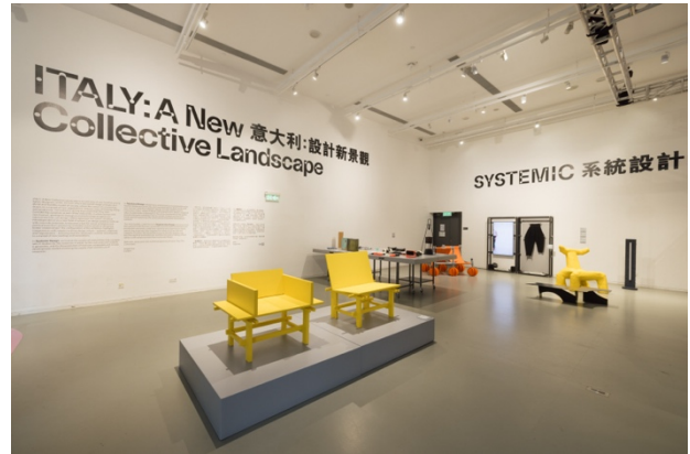
《意大利：設計新景觀》展覽場景

（香港，2024 年 1 月 19 日）香港知專設計學院（HKDI）屬下的 HKDI Gallery 於 2024 年 1 月 19 日起，舉行《馬岩松：流動的大地》及《意大利：設計新景觀》展覽，藉以啟發公眾對跨媒介設計的認識和鑒賞。