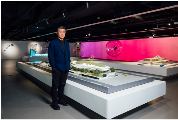
MAD 創始人及合夥人馬岩松先生

此展覽源自深圳市當代藝術與城市規劃館 2023 年的大型個展，並由 MAD 建築事務所（MAD）創始人及合夥人馬岩松親自就 HKDI Gallery 進行二次策劃，更是馬岩松首個於香港舉辦的大型個人展覽。馬岩松為近年最具國際影響力的中國建築師之一，2002 年畢業於美國耶魯大學，其作品曾於多個國際性展覽中展出。此展覽不僅揭示了馬岩松引人深思的概念和富有想像力的視野，還提供了對未來城市文明的一瞥——一個與城市景觀、歷史和自然環境和諧共存的未來。