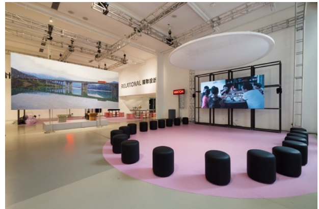
《意大利：設計新景觀》展覽場景

展覽的佈局強調三項設計特質的一致性，分別是系統性、關聯性和再生性，為展覽重組出多個新的解讀方式和關聯。展覽呈現了各種設計作品，包括家具、應用程式、服裝及印刷品等。