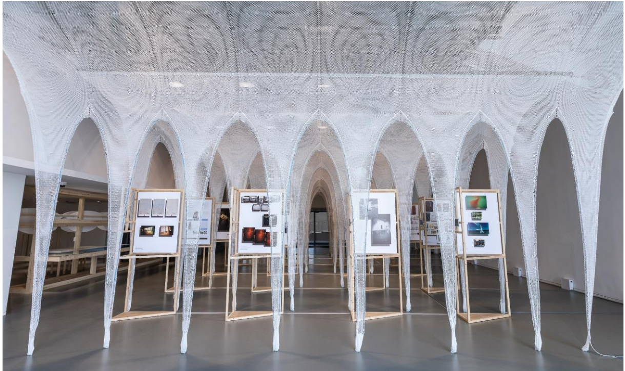
日本知名設計師藤原大個人展覽 — 《手尋未來·藤原大設計展》首度於香港舉行。

(香港·2021年2月22日) 香港知專設計學院 (HKDI) 及香港專業教育學院 (IVE) 李惠利院校一直致力透過與世界各地不同的博物館、設計院校和設計師合作，推動香港設計教育，促進業界、學生及設計愛好者等交流。院校附屬的 HKDI Gallery 今年繼續呈獻國際級設計展覽，日本知名設計師藤原大個人展覽 — 《手尋未來·藤原大設計展》首度於香港舉行，並成為跨領域設計#DesignUnfold 項目的年度旗艦展覽。